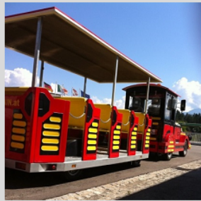
Symbolfoto, symbol photo