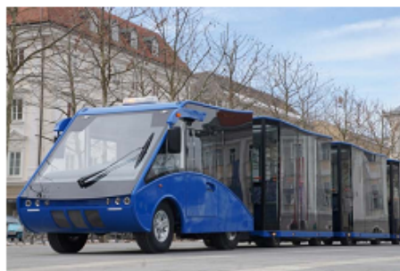
Vom Lager / from stock